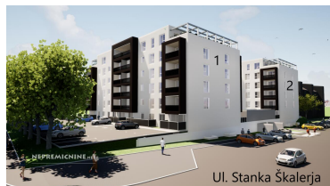
Ul. Stanka Škalerja